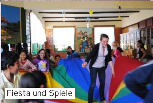
Fiesta und Spiele