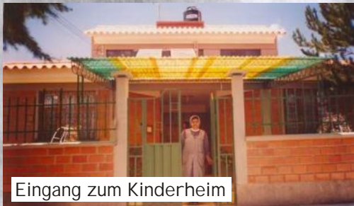
Eingang zum Kinderheim